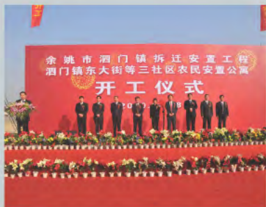
▲ 农民安置房开工仪式