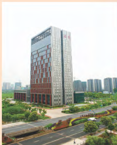
▲ 浙江清华长三角研究院

嘉兴现代服务业集聚区位于嘉兴主城区南侧，是以现代服务业为主导的产业集聚区，规划面积 110.3 平方公里，功能定位为长三角城市群国际商务中心重要功能区、浙江省现代服务业集聚发展示范区、浙江省先进制造业服务化发展先行区、嘉兴市高端要素集聚新城区，产业发展方向是全面推进总部经济、高端商贸服务业、会务会展、高端教育、高端房产等五大城市功能服务业，重点发展科技研发服务业、电子商务交易平台、新一代信息技术产业（物联网）、工业咨询与服务、现代物流业等五大生产性服务业。2011 年，嘉兴现代服务业集聚区完成基础设施投入 16.85 亿元，产业项目投入 62.15 亿元，引进内外资 54.9 亿元（外资折算为人民币）；服务业增加值占比在 2010 年 27.2% 的基础上提升至 27.9%；财政一般公共预算总收入 10 亿元，同比增长 31.9%。