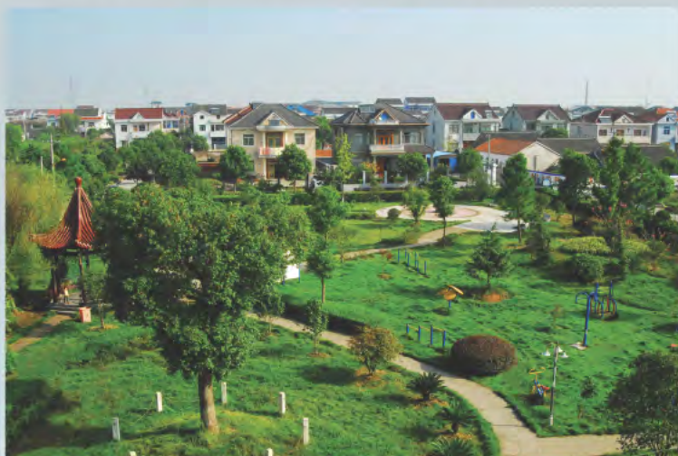
▲ 大庙周村落文化公园

余姚市泗门镇地处宁绍平原中部，濒临杭州湾，地理位置优越，是一座悠久历史与现代文明交相辉映的浙东古镇。曾先后获得“全国综合实力百强镇、全国文明镇、国家卫生镇”等荣誉称号。泗门镇小城市培育的目标是建设成为功能完善、辐射有力、工贸发达的姚西北区域发展中心和宁波西部重要门户城市，成为“实力、宜居、和谐、创新”的现代化小城市。近年来，泗门镇以“大投入、强建设、优管理、重改革”为工作载体，大力实施产业提升、城市重塑、民生普惠、改革创新、基础强健等五大行动，小城市培育试点呈现“强势推进、全面跃升”的良好态势。