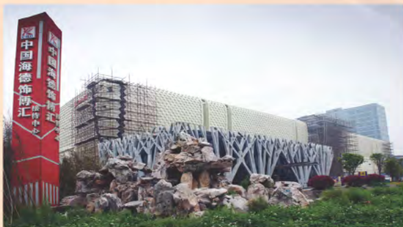
▲ 在建项目——海德饰博汇

嘉兴现代服务业集聚区位于嘉兴主城区南侧，是以现代服务业为主导的产业集聚区，规划面积 110.3 平方公里，功能定位为长三角城市群国际商务中心重要功能区、浙江省现代服务业集聚发展示范区、浙江省先进制造业服务化发展先行区、嘉兴市高端要素集聚新城区，产业发展方向是全面推进总部经济、高端商贸服务业、会务会展、高端教育、高端房产等五大城市功能服务业，重点发展科技研发服务业、电子商务交易平台、新一代信息技术产业（物联网）、工业咨询与服务、现代物流业等五大生产性服务业。2011 年，嘉兴现代服务业集聚区完成基础设施投入 16.85 亿元，产业项目投入 62.15 亿元，引进内外资 54.9 亿元（外资折算为人民币）；服务业增加值占比在 2010 年 27.2% 的基础上提升至 27.9%；财政一般公共预算总收入 10 亿元，同比增长 31.9%。