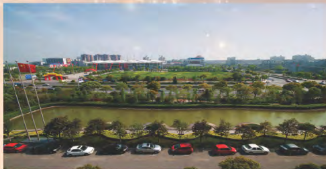
▲ 嘉兴国际会展中心