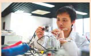
▲ 嘉兴科技城实验室